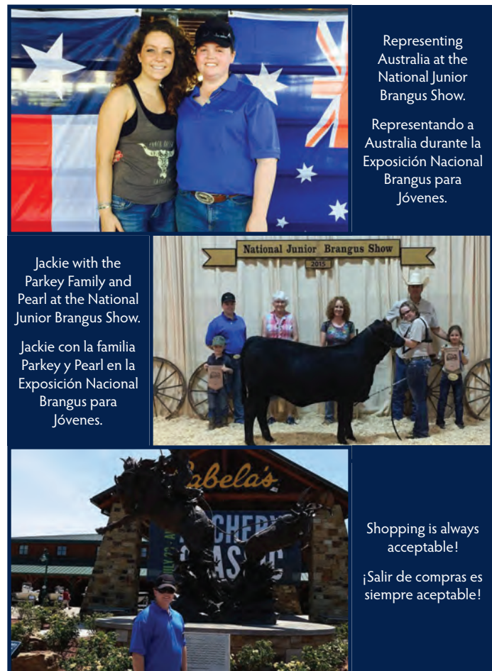
Representing Australia at the National Junior Brangus Show.